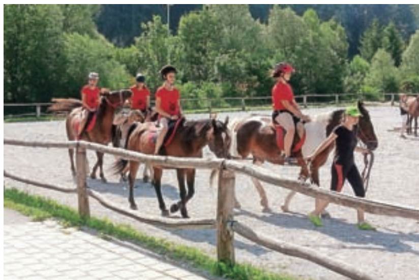
V treh enotedenskih terminih v juliju in avgustu so imeli otroci na izbiro pestro ponudbo aktivnosti.