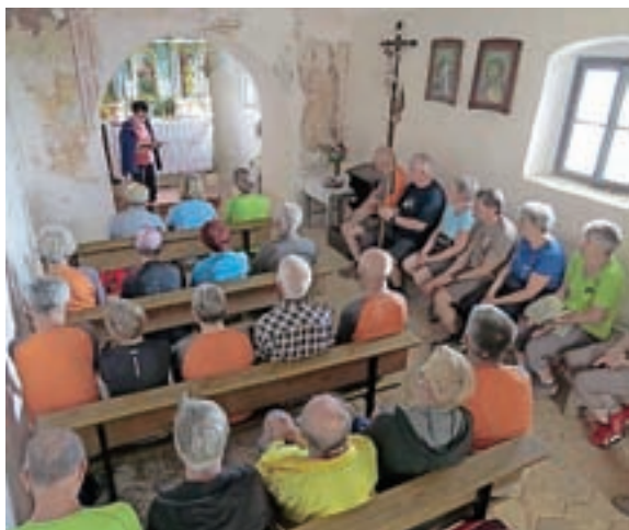
V cerkvi svetega Jakoba na cilju