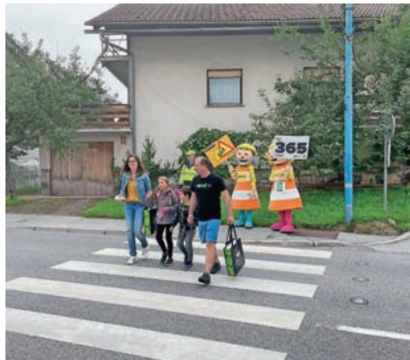
Prvošolce sta na cesti pozdravila maskoti AMZS Anja in Marko.

V okviru Sveta za preventivo in vzgojo v cestnem prometu Občine Žiri prostovoljci ZŠAM in AMD Žiri že dobrih 15 let prve šolske dni poskrbijo za varnost otrok v okolici šole in vrtca. Letos pa so bili na prvi šolski dan prijetno presenečeni, saj so dobili dodatno pomoč. Pol ure pred začetkom prve šolske ure sta se v centru Žirov pojavili še maskoti AMZS Anja in Marko,