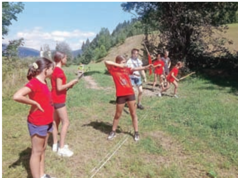
Aktivnih počitnic v Žireh se je letos skupno udeležilo več kot sto otrok in najstnikov.

Kot je pojasnil Srečo Gaber, organizator športnih dejavnosti v Žireh, se je aktivnih počitnic letos skupno udeležilo več kot sto otrok in mladostnikov. "Tokrat so se nam pridružili tudi najstniki, kar je velik uspeh, saj gre za generacijo, ki večino časa preživi pred računalniki, zato smo bili organizatorji še posebej veseli, da nam jih je s programom uspelo animirati