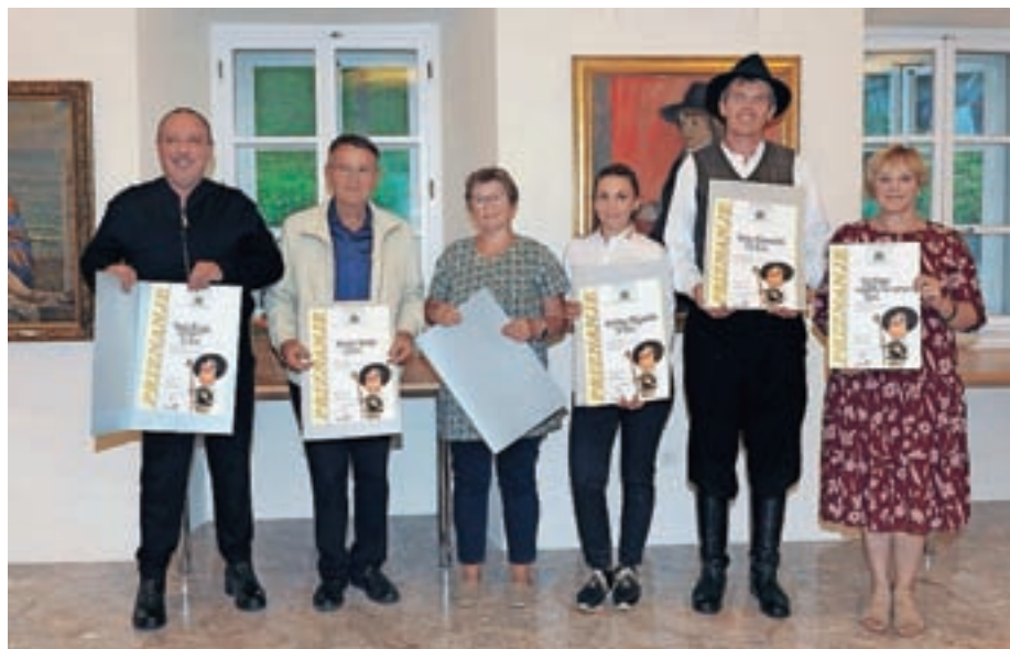
Letošnji nagrajenci iz Turističnega društva Žiri