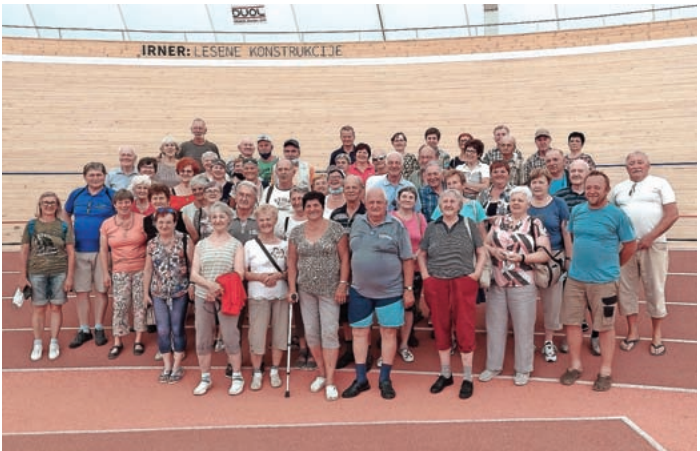
Postanek v športni dvorani Velodrom