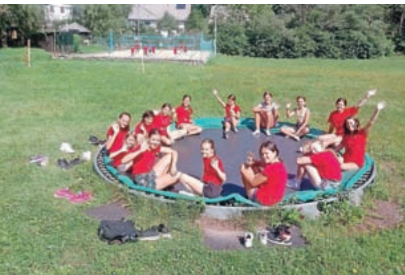
Za najmlajše je bil pripravljen celodnevni program, najstniki so imeli na voljo štiriurni dnevni program.

in jih navdušiti za šport in aktivnosti v naravi. Njihov odziv nas je prijetno presenetil, na aktivnostih so namreč pokazali veliko volje in pozitivne energije," je pojasnil Gaber in dodal: "V poletnih mesecih smo bili zelo aktivni, tudi zato so nam letošnje počitnice še hitreje minile. Bilo je polno različnih aktivnosti, otroci in animatorji smo uživali v druženju ter preživljanju skupnih dni v treh enotedenskih sklopih v juliju in avgustu. Poizkušali smo nadoknaditi nekaj zamujenega časa, ko smo bili zaradi epidemije prikrajšani za druženje in zabavo. Tokrat smo se veliko družili ter se ob tem še razmigali in zabavali. Vsi skupaj smo odnesli lepe vtise, to pa tudi največ šteje."