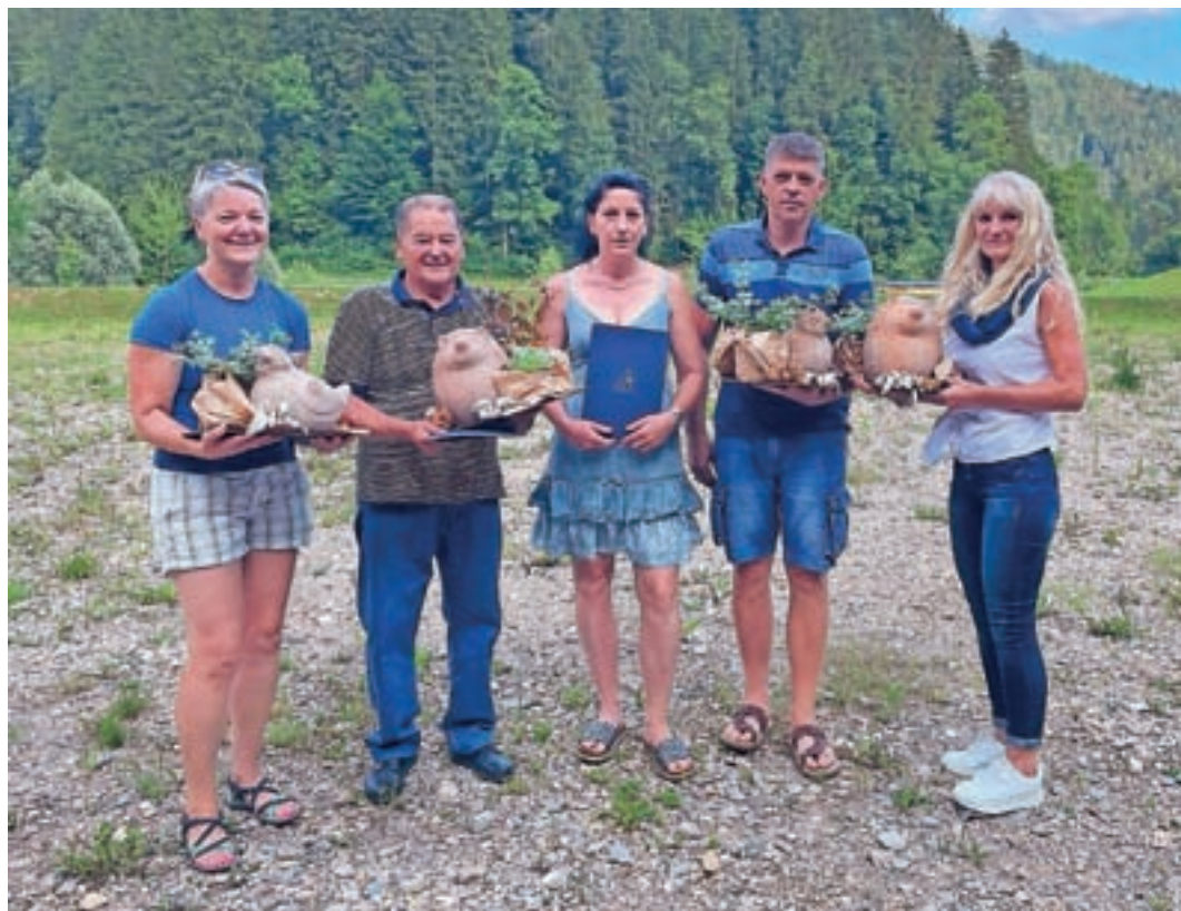
Letošnji prejemniki priznanj za najlepše urejene domove in vrtove

V juniju smo uspešno izpeljali tridnevno dogajanje ob praznovanju jubilejnega 20. Žirovskega kolesarskega kroga. Društvo po navadi v marcu pripravi občni zbor za vse člane društva, kjer jih seznanimo s preteklim delovanjem ter z načrti za naprej. Letos smo bili zaradi epidemije primorani občni zbor odpovedati oziroma ga prestaviti na ugodnejši čas za organizacijo našega druženja. Julija, ko nas je sonce toplo grelo, smo zato vse člane povabili, da skupaj, ob druženju v obliki piknika, preživimo lepo popoldne v ŠRC Pustotnik. Po kratkem uvodnem pozdravu in predstavitvi prihodnjih načrtovanih dogodkov ter glasbeni spremljavi na-