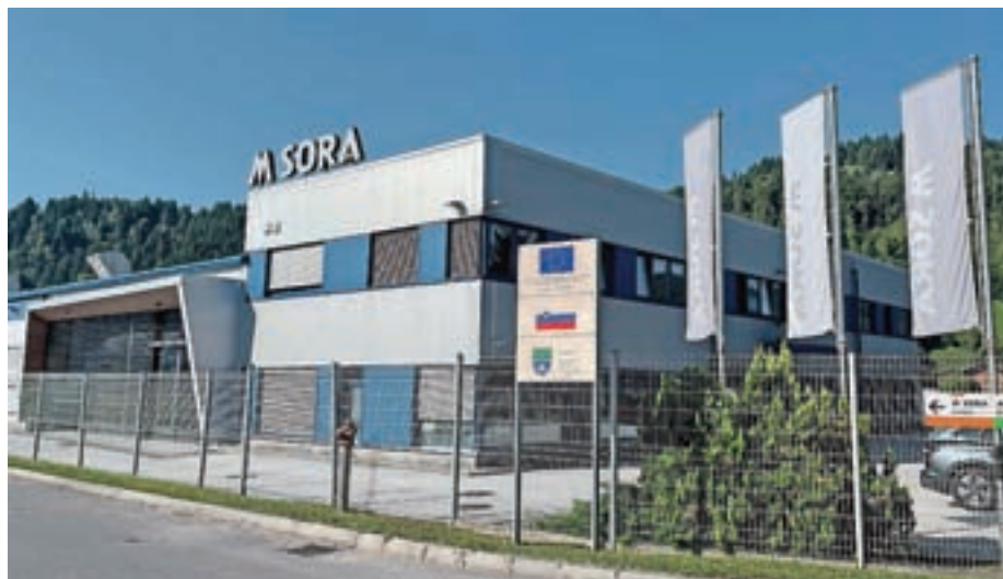
V družbi M Sora bodo z dokapitalizacijo razširili krog delničarjev.

V družbi namreč verjamejo, da imajo zunanji lastniki drugačne interese