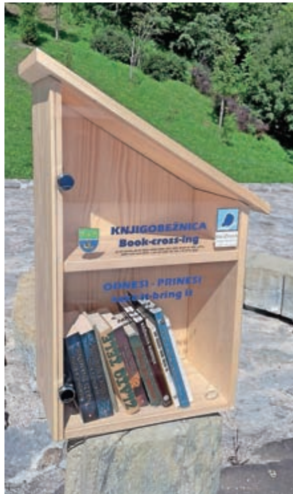
Knjigobežnice so našle mesto tudi v Žireh.

Knjigobežnice se pri nas pojavljajo že od leta 2011, zdaj pa smo jih postavili tudi v Žireh, in sicer eno v centru Žirov in